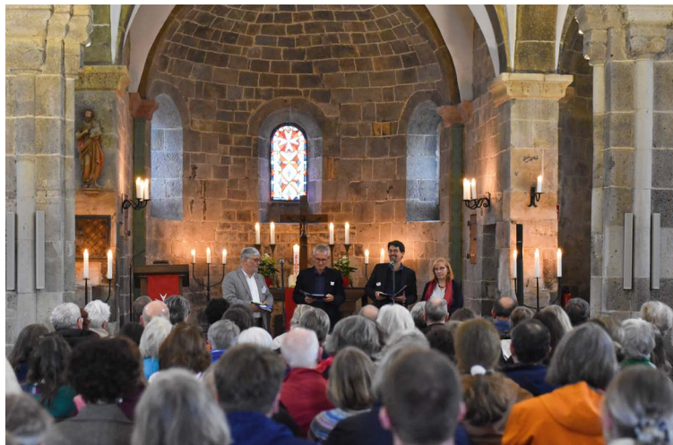
Eindruck vom 1. Impuls- und Begegnungstag 2024.

Rund um die eindrucksvolle Komturkirche in Nieder-Weisel erstreckt sich das Geistliche Zentrum Nieder-Weisel, gemeinsam getragen von Johannitern und dem Evangelischen Dekanat Wetterau. Es ist ein Ort, an dem Glaube gelebt wird. Unterschiedlichste geistliche Veranstaltungen laden dazu ein eine Pause vom Alltag zu machen und neue Kraft zu schöpfen. Zum Geistlichen Zentrum Nieder-Weisel gehören neben der Komturkirche ein modernes Tagungszentrum mit vielen Seminarräumen sowie das angeschlossene Hotel mit Restaurant.